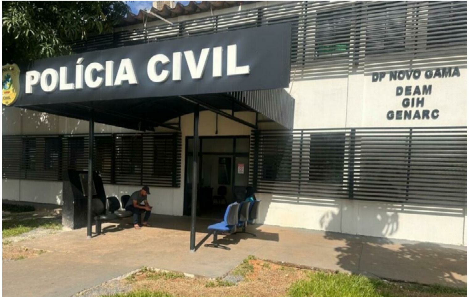
Durante o processo investigativo, o adolescente alegou que o crime foi motivado pelo fato de a vítima ter assediado sua irmã

Durante o processo investigativo, o adolescente alegou que o crime foi motivado pelo fato de a vítima ter assediado sua irmã, mas essa justificativa não foi confirmada pelas autoridades. De acordo com a apuração, a vítima e o infrator eram amigos e, no dia do crime, estavam consumindo bebidas alcoólicas quando uma discussão por motivos banais resultou no ataque fatal.