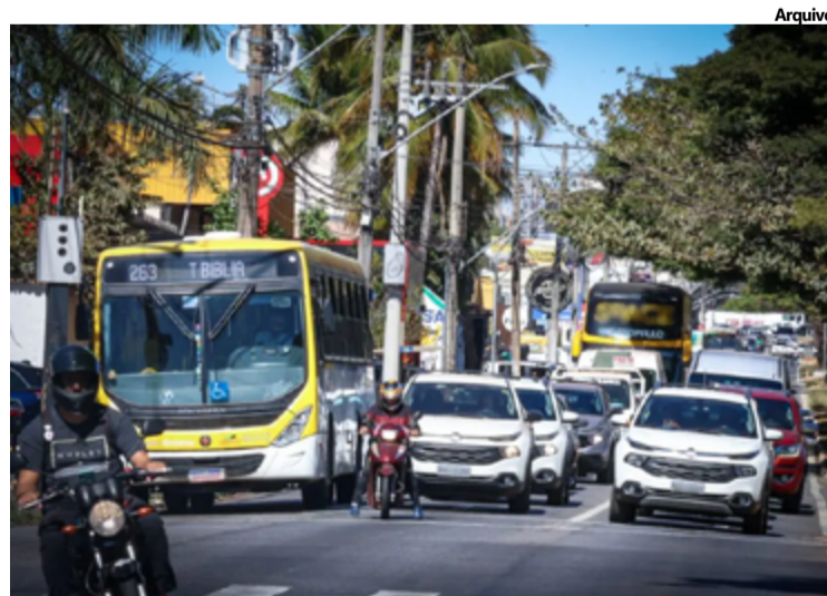
Até o momento, o número total de parcelamentos ativos já alcança 26 mil contribuintes

A carteira de créditos da Secretaria da Economia atualmente inclui 791,9 mil parcelas, totalizando R$ 3,08 bilhões a receber. Conforme apurado pela Superintendência de Recuperação