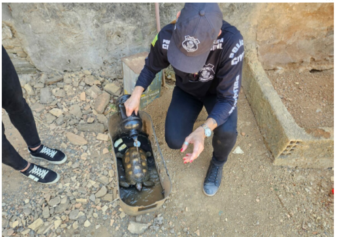
A equipe da Polícia Técnico-Científica foi acionada para verificar as condições dos animais e constatou a ocorrência de maus-tratos

A situação encontrada pelos policiais em Luziânia destaca a importância da vigilância e denúncia de casos de maus-tratos a animais. De acordo com