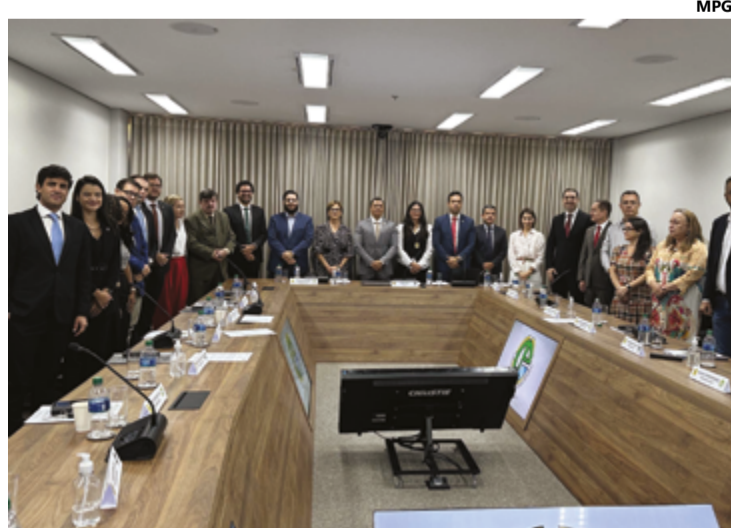
Novos conselheiros do Copen, em posse realizada na sede do MPGO

O diretor-geral de Administração Penitenciária e presiden-