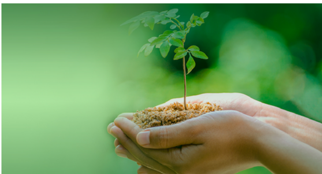
Recursos do fundo não poderão ser repassados ao Tesouro Estadual