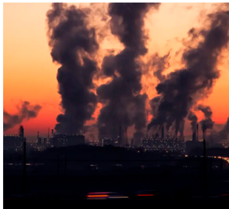
Estudo levanta níveis estabelecidos como padrão de qualidade do ar permitidos em diversos países

De acordo com o estudo, leis nacionais no Chile, Colômbia, Equador, Espanha e França definem os níveis críticos de poluição. México e Estados