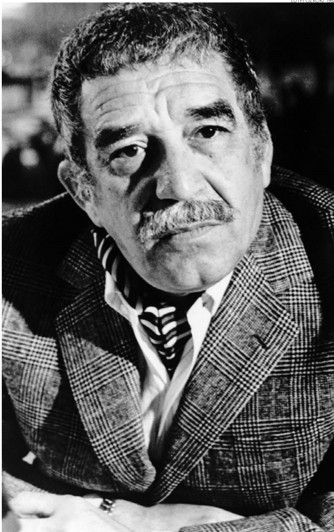
Gabo deixou extensa produção literária e jornalística que reverbera até hoje

Com isso, se referia à convivência com o avô, que lhe contava histórias de guerras passadas (e o levou para conhecer o gelo) e a infinidade de parentes