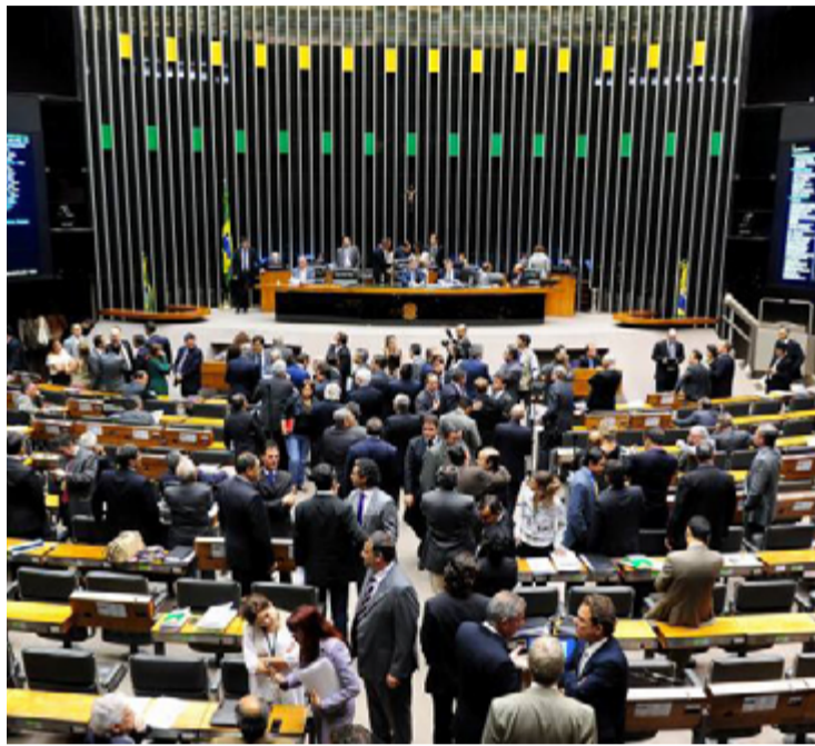
Dirigentes de partidos pressionaram congressistas para aumentar receitas financeiras

nanciamento de campanha em 2024 serão distribuídos entre 29 partidos, conforme estabelecido pela lei eleitoral. O PL é o partido que vai receber a maior fatia, com 18% do fundo, seguido do PT (13%) e do União Brasil (11%).