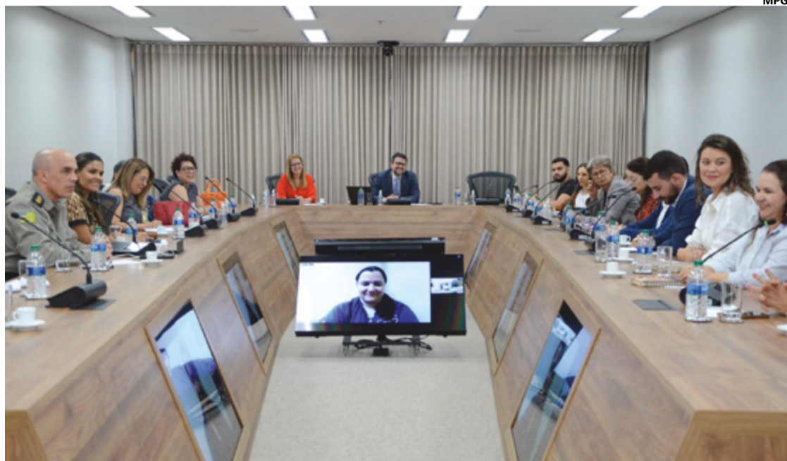
À mesa o MPGO, Governo de Goiás, conselhos representativos dos idosos, direitos humanos e universidades

Dentro das proposições levantadas pelas instituições parceiras, foram apresentados os principais desafios enfrentados como: especialização e a capacitação de profissionais; agilidade em identificar casos de abusos ou negligência; falta