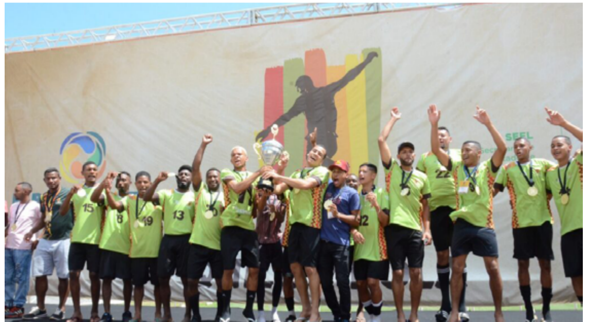
Equipe do Vão do Moleque, de Cavalcante, conquistou o último título do torneio masculino

Além disso, a Seel e o Goiás Social oferecem suporte logístico para as equipes participantes, entregando kits que incluem materiais